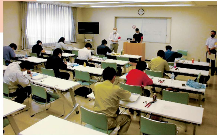
3級検定試験の様子