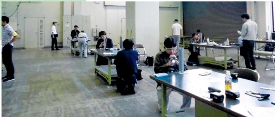
検定試験昨年の様子