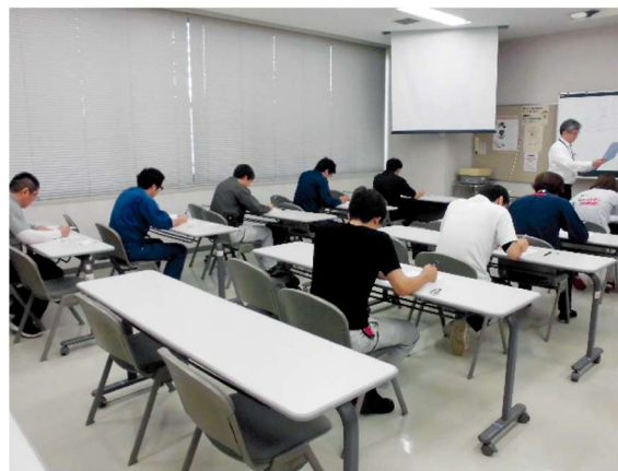
検定試験昨年の様子

厚生労働大臣認定の社内検定である「錠施工」2級の検定試験を下記にて実施いたします。