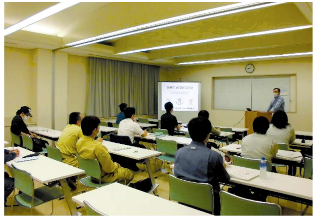
3級検定試験の様子

「錠施工」3級検定試験が令和2年7月4日(土)日立システムズホール仙台(宮城県仙台市)において実施され、8名の合格者に「3級錠施工技師」の称号が与えられました。