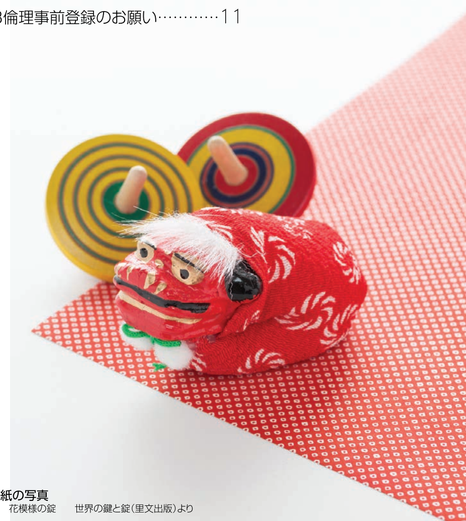
●表紙の写真 ドイツ 花模様の錠 世界の鍵と錠(里文出版)より