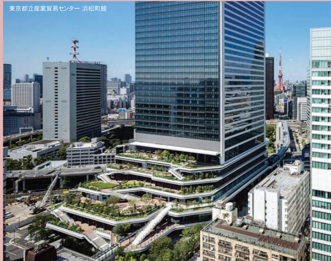
東京都立産業貿易センター 浜松町館

施設建て替え等の理由により2014年度を最後に開催が未定となっておりました当組合主催の展示会を、2023年9月22日(金)・23日(土)の2日間にわたり開催する事が決定致しました。会場はリニューアルしました東京都立産業貿易センター浜松町館となります。先日も展示会P.T.が開かれ、よりよい展示会にするためメンバー一同知恵を絞り討議を行ってまいりました。詳細が決まりましたら皆様にも発信してまいりますので、どうぞご期待下さい。