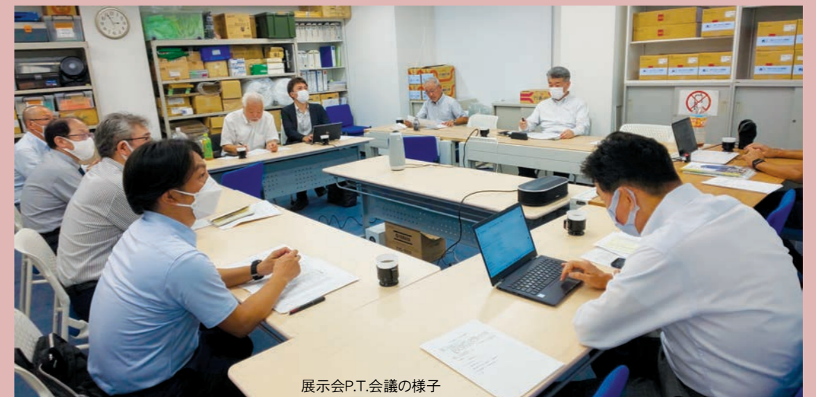
展示会P.T.会議の様子